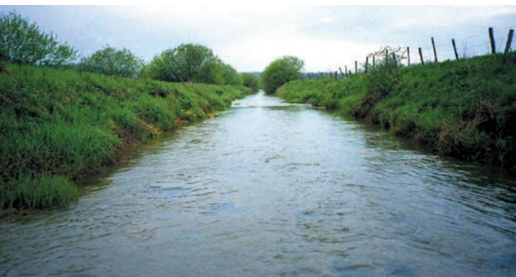
André Rousselet - Onéma