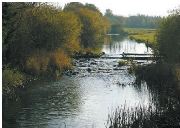
Remise en eau d'ancien méandre du Drugeon et conservation du lit rectifié. Un seuil de répartition permet la remise en eau du méandre (octobre 2008).

Les suivis montrent une amélioration de la qualité des habitats du cours d'eau. La qualité habitationnelle varie en fonction des techniques de restauration utilisées. Elle sera maximum dans les cas de reméandrage et plus limitée lorsqu'il s'agit de diversification.