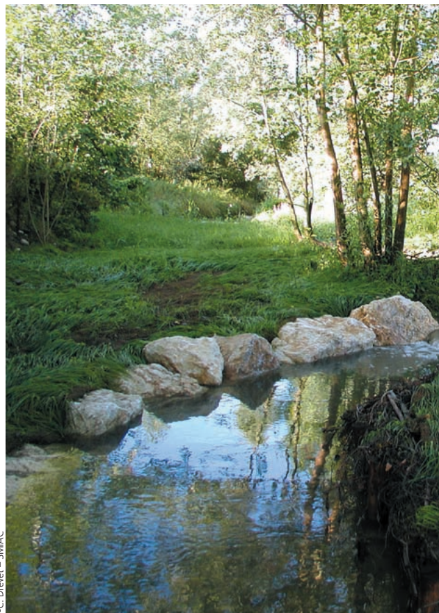
J.-C. Drevet - SMIAC