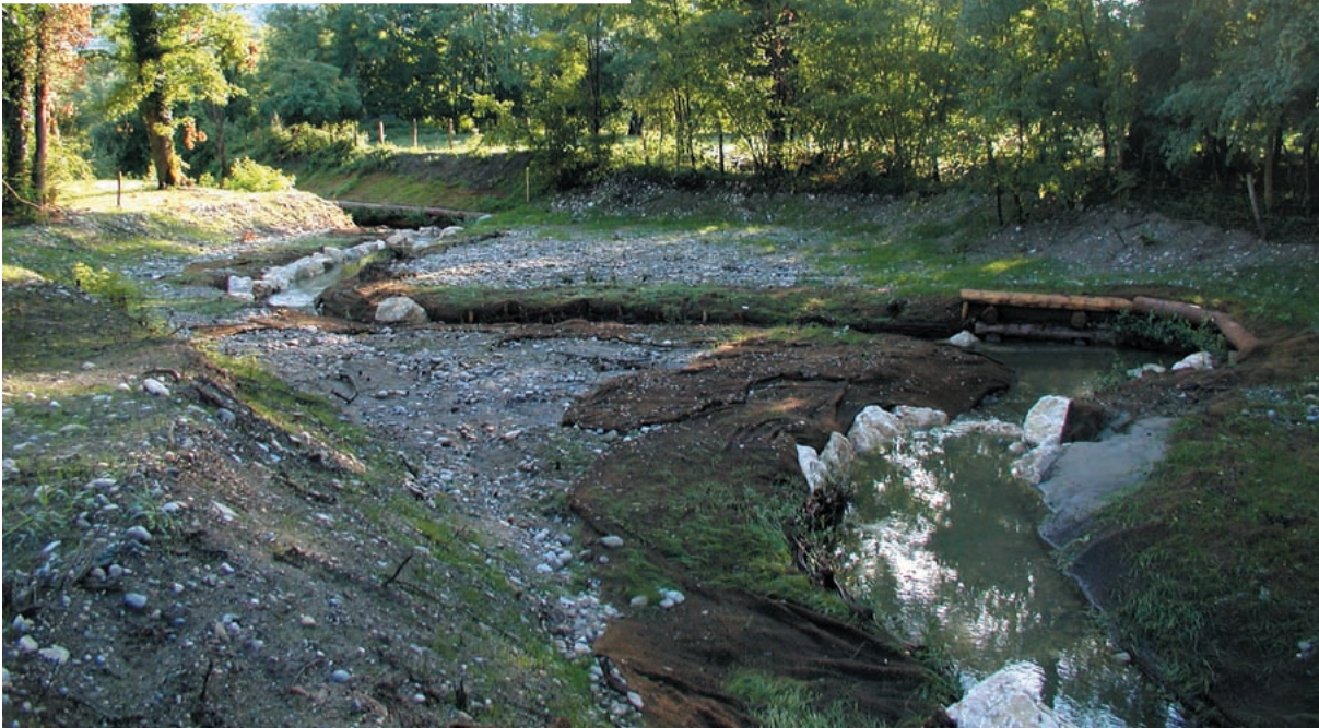
J.-C. Drevet – SMIAAC

À gauche, l'ancien lit recalibré, en juin 2004. Ci-dessous, retour dans le lit d'origine méandriforme.