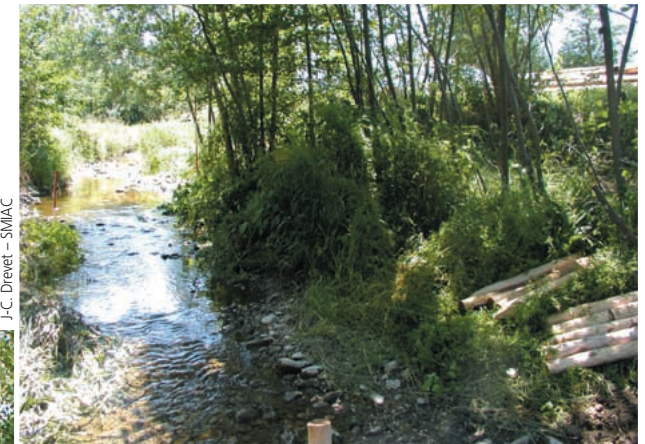
J.-C. Drevet - SMIAC

En bas, le nouveau lit méandriforme permettant la dissipation des crues. La ripisylve en place a été maintenue.