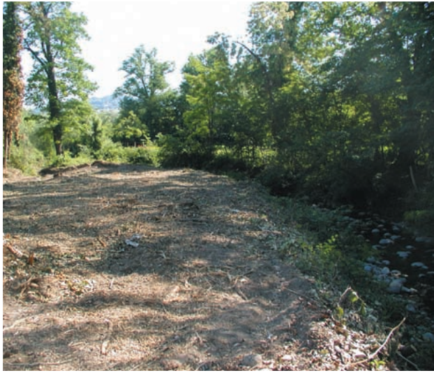
J.-C. Drevet – SMIAAC

De plus, le secteur aval du Dadon a connu de fortes perturbations physiques lors de l'installation d'une zone industrielle sur son secteur aval : un drainage de la zone humide associée, des prélèvements d'eau ainsi qu'une rectification et un endiguement de son lit. Outre les perturbations d'ordre physico-chimique dont souffre ce cours d'eau, l'appauvrissement de l'habitat induit par l'homogénéisation et le surdimensionnement du lit entraîne un effondrement de ses potentialités piscicoles et de ses fonctions reproductrices, notamment en ce qui concerne la truite fario.